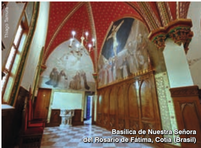
Basílica de Nuestra Señora del Rosario de Fátima, Cotia (Brasil)