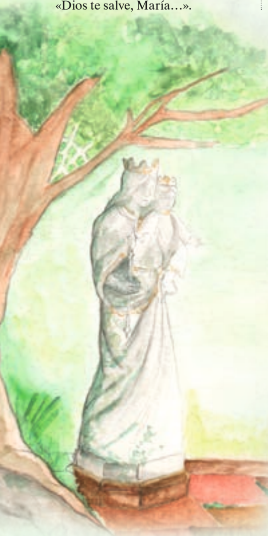
Se acercó y reconoció la figura de María Auxiliadora