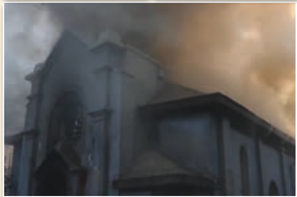
Capturas de pantalla de un vídeo difundido por la EWTN que muestra el ataque a la iglesia de la Asunción

embajadores de los países latinoamericanos con presencia salesiana.