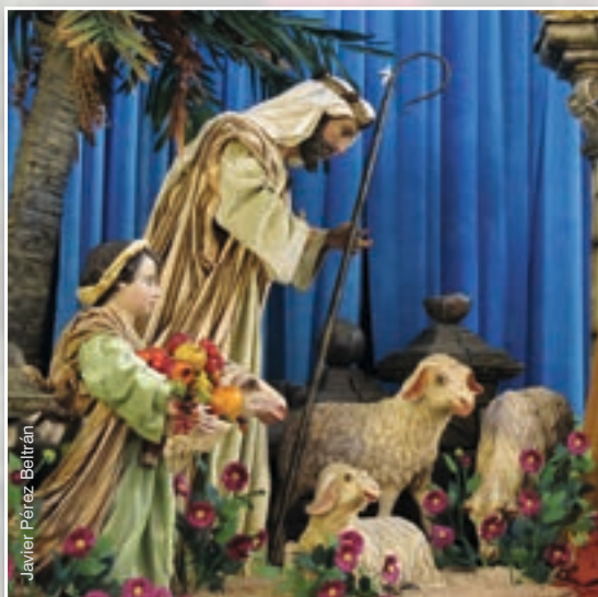
Javier Pérez Beltrán

Fueron apareciendo nuevas explicaciones para vincular todavía más esos bastoncitos al Nacimiento del Redentor: unos consideraron su dulzura como una rememoración de que somos alimentados y reconfortados