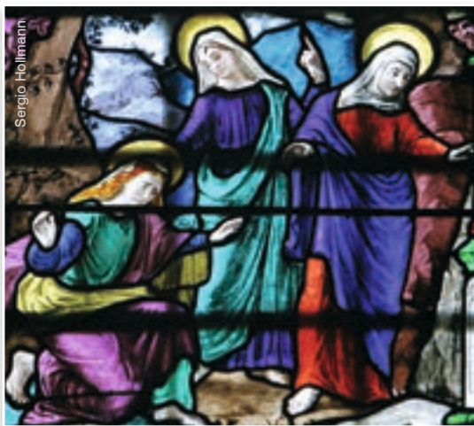
Cuando Jesús se ofreció a los suyos en una cena... yo aún no existía...

Cuando empezaron a levantarse mis paredes, Constantino ya había dado libertad de culto a los católicos. Mis ventanas, inicialmente pequeñas, con el paso de los siglos acabaron siendo marcadas por un arte más angélico que humano. Me volví esbelta. Había llegado a mi juventud y era muy hermosa.