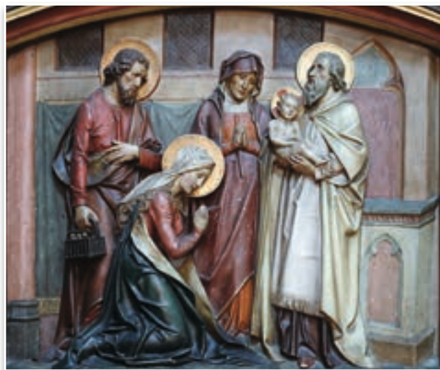
La Presentación del Niño Jesús en el Templo Catedral de San Bavón, Gante (Bélgica)

Debemos compenetrarnos de que quien abraza el camino de Jesús con sinceridad y trata de vivirlo en sí, mediante una conducta transparente, impregnada de santidad, acaba transformándose en piedra de escándalo y signo de contradicción, como Él, propiciando la ocasión para que muchos corazones se revelen.