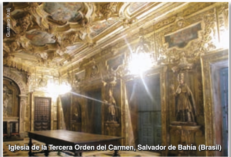
Iglesia de la Tercera Orden del Carmen, Salvador de Bahía (Brasil)

Aun así, el aislamiento no me entristece. En los momentos de silencio, puedo recordar un hecho evangélico que mis paredes retratan: «Tú eres Pedro, y sobre esta piedra edificaré mi Iglesia...»