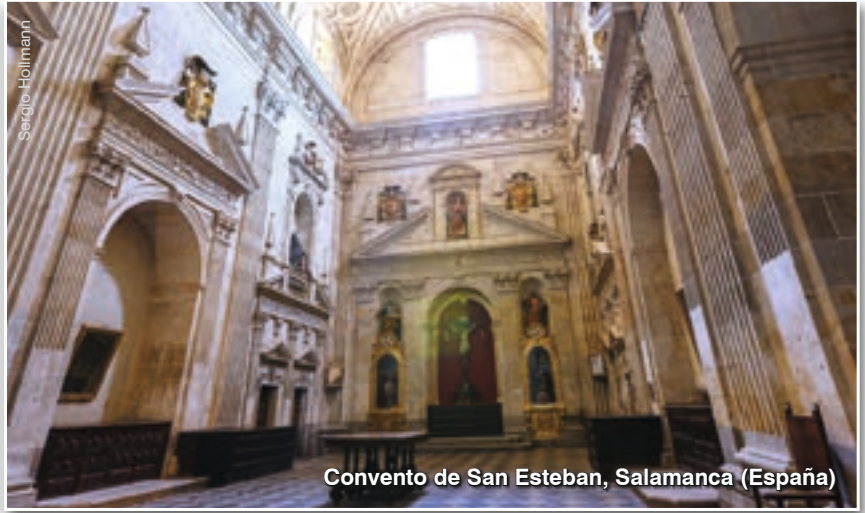
Convento de San Esteban, Salamanca (España)