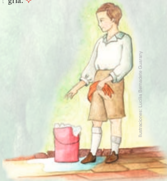
Una vez a la semana, los niños limpiaban la imagen milagrosa

—El corazón de un niño obediente es mi descanso y la compañía de los que me aman es mi alegría. ✧