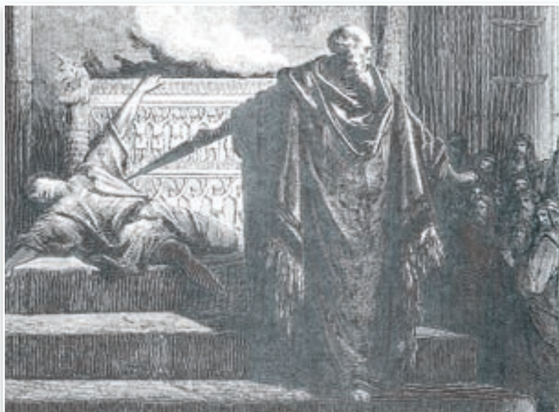
En un arrebato de ira santa, Matatías corrió a degollar a aquel hombre sobre el ara