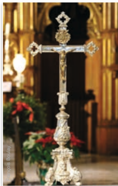
Crucifijo - Parroquia de San Pedro Apóstol, Montreal (Canadá). En la foto anterior, presbiterio de la basílica de Nuestra Señora del Rosario adornado para la Solemnidad de la Anunciación, Caieiras (Brasil)

Al analizar los significados de esa insignia en las celebraciones versu populum , Benedicto XVI afirma: «La cruz del altar no es un obstáculo para verse, sino el punto de referencia común. [...] Es para todos la imagen, que recoge y une nuestras miradas. [...] De esta manera quedaría clara la