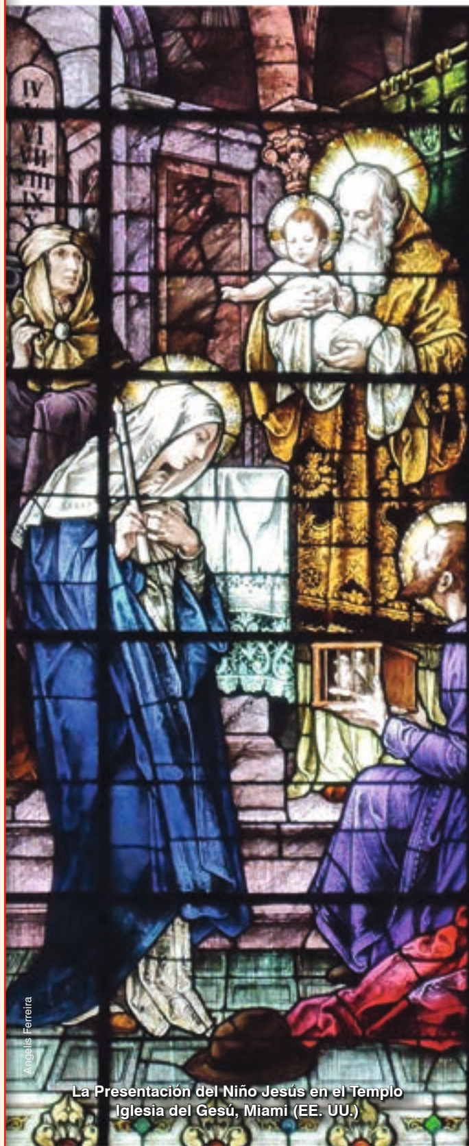
La Presentación del Niño Jesús en el Templo Iglesia del Gesú, Miami (EE. UU.)

39 Y, cuando cumplieron todo lo que prescribía la Ley del Señor, se volvieron a Galilea, a su ciudad de Nazaret. 40 El niño, por su parte, iba creciendo y robusteciéndose, lleno de sabiduría; y la gracia de Dios estaba con Él (Lc 2, 22-40).