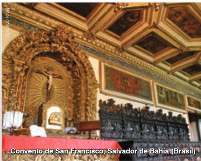
Convento de San Francisco, Salvador de Bahía (Brasil)