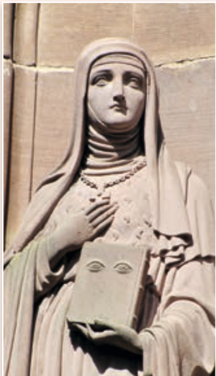
Ralph Hammann (CC by-sa 4.0)

Las almas que contemplaban los santos de la Alta Edad Media, cuyas vistas sobrenaturales eran mucho más penetrantes que las nuestras, vivían la fe de forma intensa. Lo espiritual y lo terreno se mezclaban armoniosamente en sus corazones, dando origen a relatos rebosantes de episodios maravillosos, aunque a veces imprecisos o incluso contradictorios en los detalles concretos.