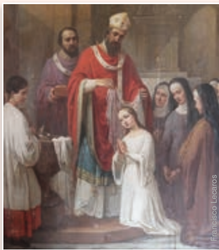
«Levántate y parte: bautizarás a una virgen ciega de nacimiento y, después del Bautismo, ella verá la luz del día»