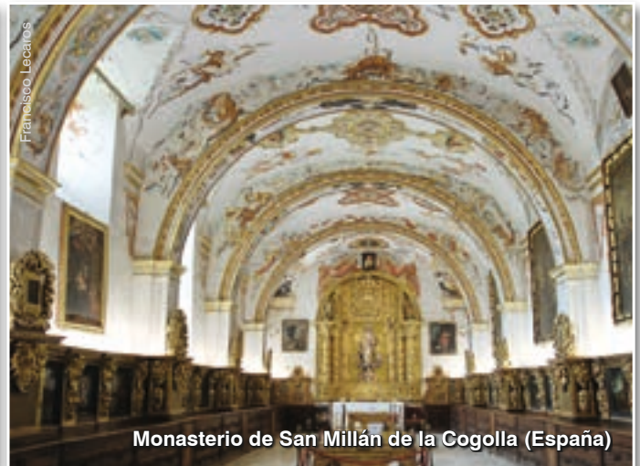
Monasterio de San Millán de la Cogolla (España)