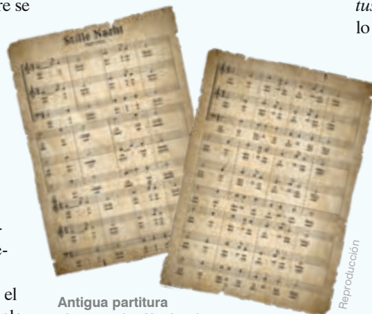
Antigua partitura alemana de «Noche de paz»

¡Ya pueden imaginarse lo que sería un grupo de veinte niños juntos, comiendo y bebiendo a voluntad! Al ser yo muy amigo de los colores, mi atención se fijaba rápidamente en unos caramelos dorados o de color naranja, en forma de pequeños anillos, números o animales, azucarados por fuera y que contenían variados licores.