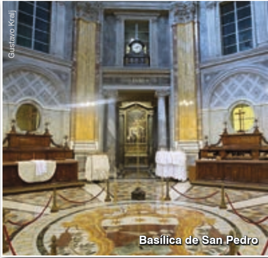
Basílica de San Pedro