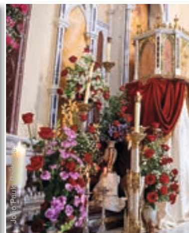
Flores y candelabros adornan el altar mayor, la capilla de la adoración al Santísimo Sacramento y el Monumento del Jueves Santo en la basílica de Nuestra Señora del Rosario, Caieiras (Brasil)

En cuanto a su historia, sabemos que solamente «en la primera mitad del siglo XI se empieza a poner los candelabros sobre el altar» 7 . Antes se solían dejar en el suelo, delante de éste.