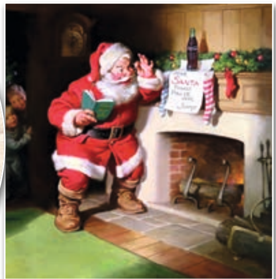
A la izquierda, portada de la revista «Harper's Weekly» del 3 de enero de 1863, con una de las primeras representaciones del moderno Santa Claus; en el centro, dibujo de Thomas Nast para la misma publicación, en 1881, para la misma publicación; a la derecha, una de las ilustraciones creadas por Haddon Sundblom para Coca-Cola en las décadas de 1920 y 1930