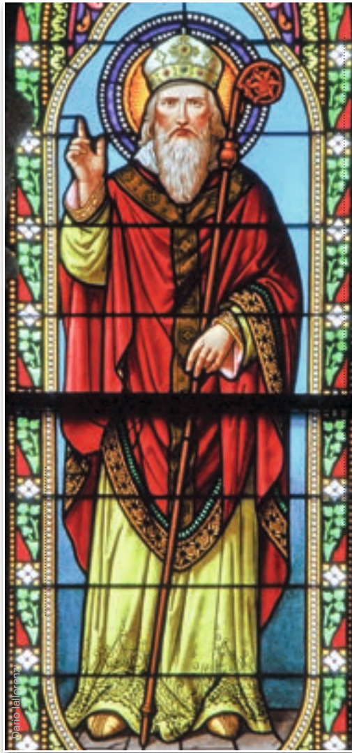
San Nicolás - Basílica de Nuestra Señora de Luján (Argentina)

Por consiguiente, mucho más que simples nomenclaturas históricas, se podría decir que esos personajes —Papá Noel y San Nicolás— simbolizan, ante el sublime hecho del Nacimiento del Divino Infante, dos mentalidades opuestas: una es la de los que, con sus horizontes puestos en este mundo terrenal, «vuelan» por los aires de las fantasías frívolas presentadas por