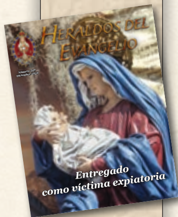
La Virgen con el Niño Jesús - Iglesia de Nuestra Señora de la Merced, Antigua Guatemala

Este «domingo del año» es una ocasión para que también nosotros nazcamos «de nuevo» (cf. Jn 3, 3). ¿Cómo? Imitando el ejemplo de María en Belén. Si Ella conservó y conserva en su corazón todos los hechos ocurridos en torno al pesebre (cf. Lc 2, 19), por medio de Ella la Navidad alcanzará su máxima perfección. ✦