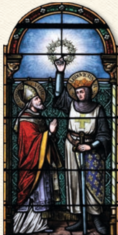
San Luis IX con San Eusebio de Vercelli - Iglesia de San Pantaleón, Guebreschwihir (Francia)

31. Santos José de Arimatea y Nicodemo . Recogieron el cuerpo de Jesús bajado de la cruz y, envolviéndolo en una sábana, lo pusieron en el sepulcro.