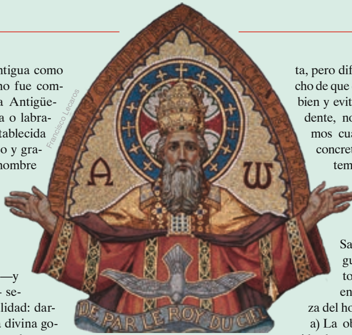
Dios Padre - Basílica de Santa Juana de Arco, Domrémy (Francia). En la página anterior, tormenta en el faro de Porthcawl (Gales)

He aquí el «principio primero y generalísimo» 8 de la ley natural, del