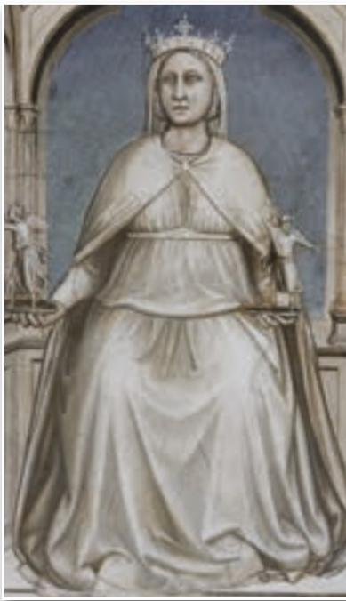
Alegoría de la virtud de la Justicia, por Giotto di Bondone - Capilla de los Scrovegni, Padua (Italia)

Quienes deberían ser los garantes de la ley se muestran especuladores oportunistas que la usan en favor de sus intereses personales