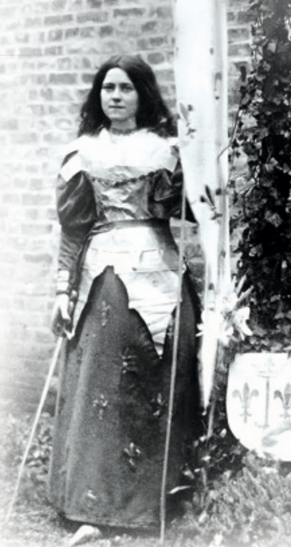
Arriba, Santa Teresa del Niño Jesús vestida de Juana de Arco, en 1895; a la izquierda, en el patio del Carmelo de Lisieux, en 1896

No obstante, mucho antes del abad de Sept-Fons, nuestro divino Modelo nos dio el ejemplo supremo. Al disponerse a comenzar su vida pública, Nuestro Señor Jesucristo pasó cuarenta días en retiro en el desierto; durante los tres años que predicó en Israel, previamente a cada gran acción se recogía en la soledad de las montañas para orar al Padre; por último, en vísperas de iniciar su pasión salvadora, se dirigió al huerto de los olivos para meditar y rezar. Nadie jamás ha actuado como el Redentor, ni con mayores frutos;