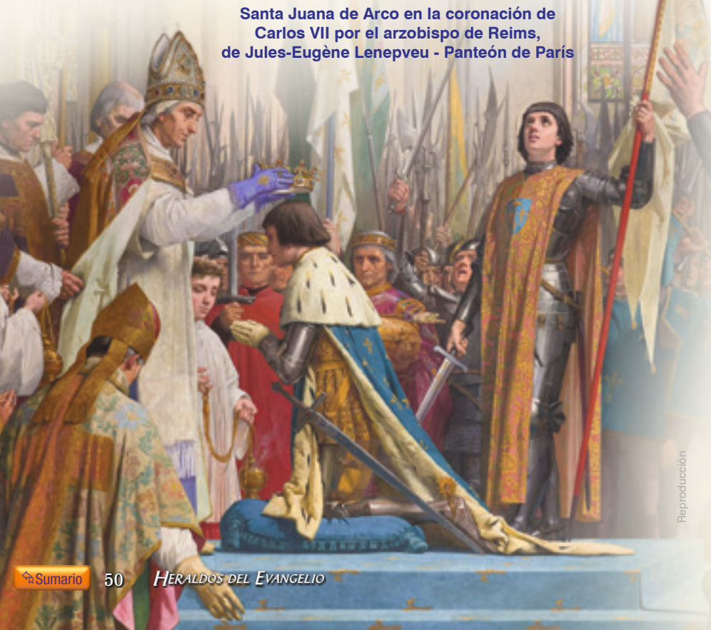
Santa Juana de Arco en la coronación de Carlos VII por el arzobispo de Reims, de Jules-Eugène Lenepveu - Panteón de París

En primer lugar, se sabe que la santa carmelita dirigió espiritualmente a dos misioneros y, por sus cartas, se percibe que comprendía las misiones mejor que ambos, y con más profundidad