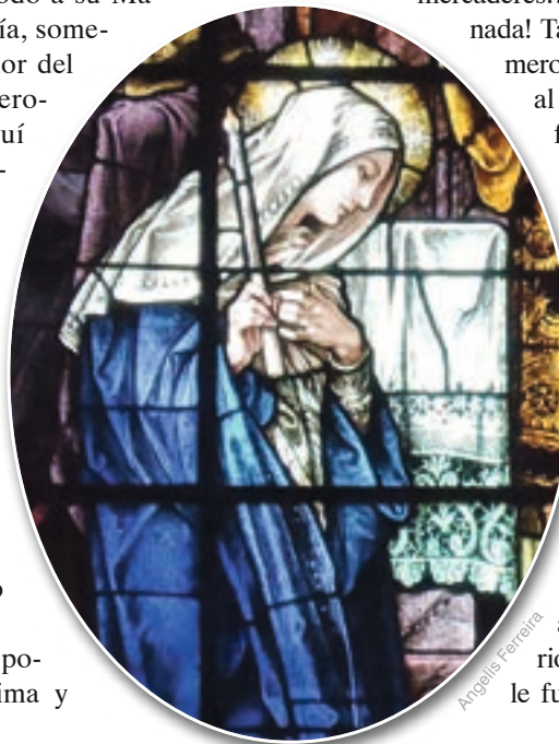
Detalle de La Presentación del Niño Jesús en el Templo - Iglesia del Gesú, Miami (EE. UU.)

Cuando Simeón vio entrar a San José y a María con el Niño Jesús, su corazón palpitó de emo-