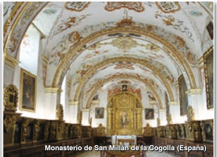
Monasterio de San Millán de la Cogolla (España)