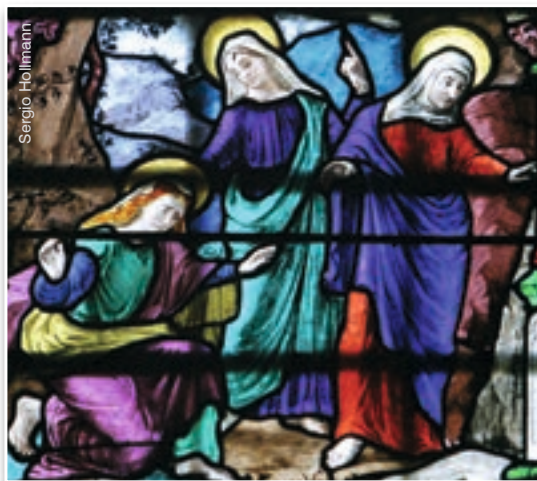
Cuando Jesús se ofreció a los suyos en una cena... yo aún no existía...

Cuando empezaron a levantarse mis paredes, Constantino ya había dado libertad de culto a los católicos. Mis ventanas, inicialmente pequeñas, con el paso de los siglos acabaron siendo marcadas por un arte más angélico que humano. Me volví esbelta. Había llegado a mi juventud y era muy hermosa.