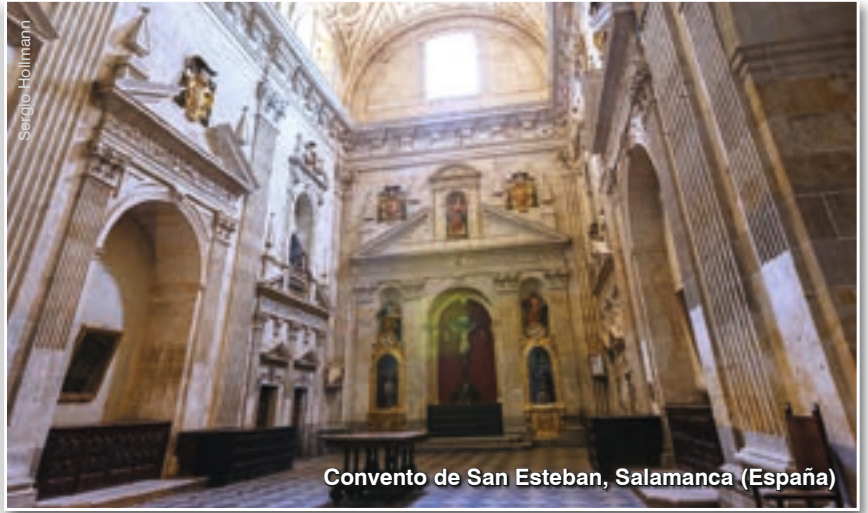
Convento de San Esteban, Salamanca (España)