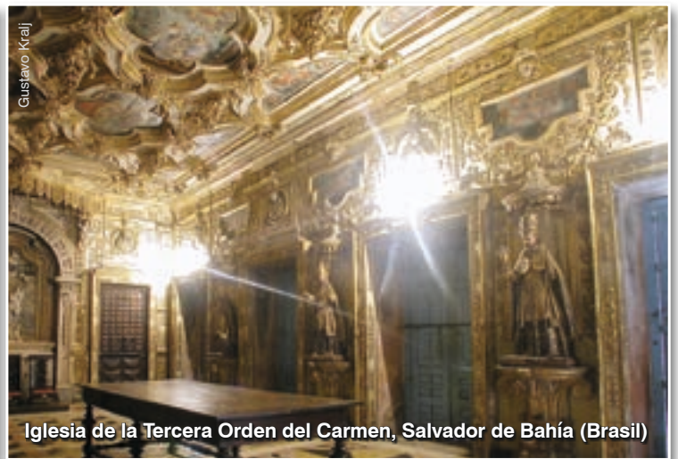
Iglesia de la Tercera Orden del Carmen, Salvador de Bahía (Brasil)

Aun así, el aislamiento no me entristece. En los momentos de silencio, puedo recordar un hecho evangélico que mis paredes retratan: «Tú eres Pedro, y sobre esta piedra edificaré mi Iglesia...»