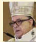
Cardenal Raymundo Damasceno Assis

El misterio de la noche de Navidad nos enseña a vivir la virtud de la humildad.