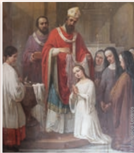
«Levántate y parte: bautizarás a una virgen ciega de nacimiento y, después del Bautismo, ella verá la luz del día»