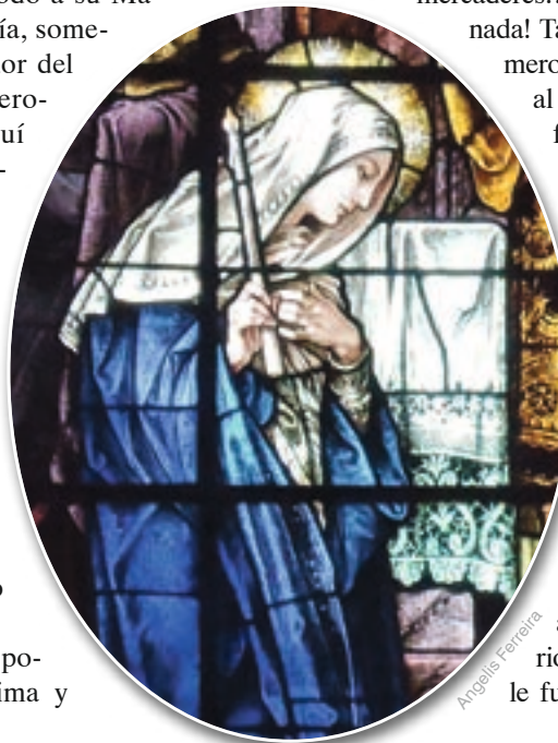
Detalle de La Presentación del Niño Jesús en el Templo - Iglesia del Gesù, Miami (EE. UU.)

Cuando Simeón vio entrar a San José y a María con el Niño Jesús, su corazón palpitó de emo-