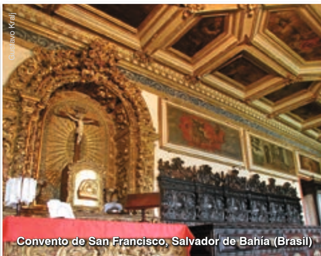
Convento de San Francisco, Salvador de Bahía (Brasil)