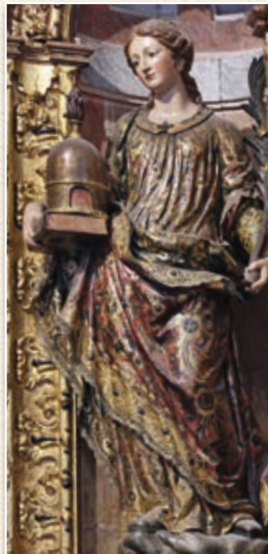
Santa Eulalia de Mérida Catedral de Oviedo (España)

29. Santo Tomás Becket , obispo y mártir (†1170 Canterbury - Inglaterra).