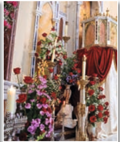
Flores y candelabros adornan el altar mayor, la capilla de la adoración al Santísimo Sacramento y el Monumento del Jueves Santo en la basílica de Nuestra Señora del Rosario, Caieiras (Brasil)

En cuanto a su historia, sabemos que solamente «en la primera mitad del siglo XI se empieza a poner los candelabros sobre el altar» 7 . Antes se solían dejar en el suelo, delante de éste.