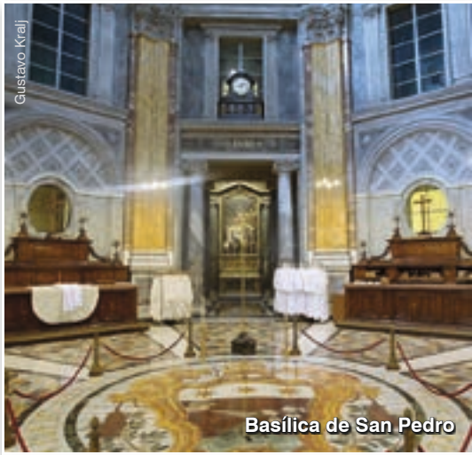
Basílica de San Pedro