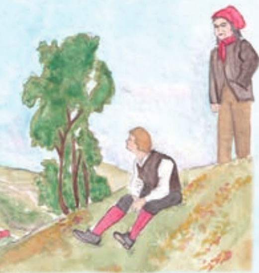
A medida que pasaba el tiempo, Leopoldo se estaba volviendo diferente...

Cuando parecía que estaba presto a ser descubierto, oyó un disparo que procedía del jacobino. Se siguieron unos instantes de silencio. De repente, percibió que aquella persona se estaba acercando... Pero, curiosamente, Gabriel ya no sentía pavor, se levantó y ise encontró con su pa-