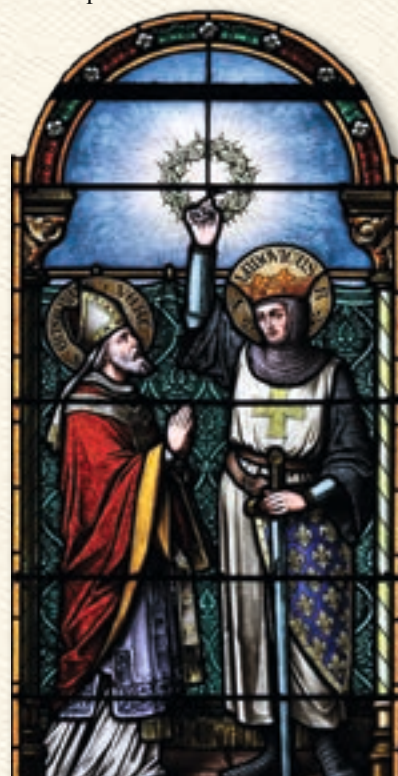
San Luis IX con San Eusebio de Vercelli - Iglesia de San Pantaleón, Guebreschwihl (Francia)