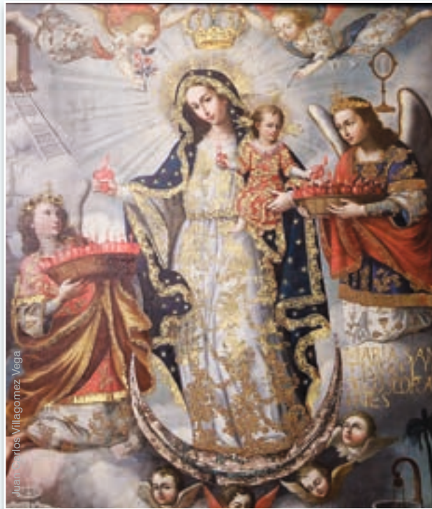
Nuestra Señora de los Corazones - Monasterio de Santa Clara, Quito

Ser Reina de los corazones significa que María Santísima tiene autoridad sobre la mente y la voluntad de los hombres. Ella puede desvencijar-