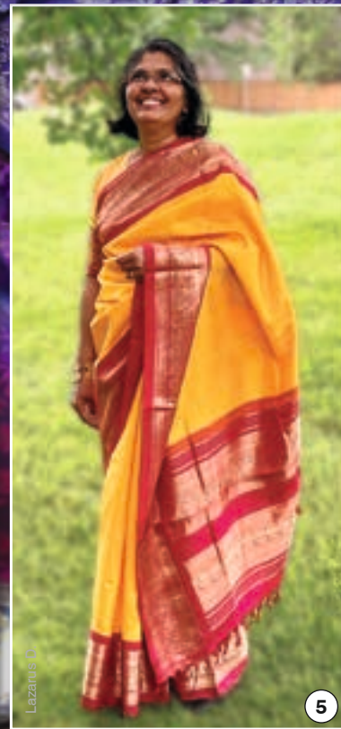
Mujeres con el sari: 1 - Estudiante del Colégio Arautos do Evangelho Internacional, Caieiras (Brasil); 2 y 4 - Familia fotografiada con motivo de una boda em Kerala (India); 3 y 5 - Cooperadora de los Heraldos del Evangelio en Ontario (Canadá)