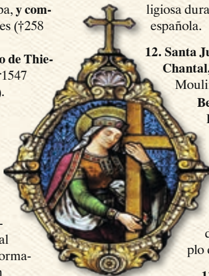
Santa Elena - Iglesia de San Quiliano, Alsacia (Francia)

Santa Rosa Fan Hui , virgen y mártir (†1900). En la persecución