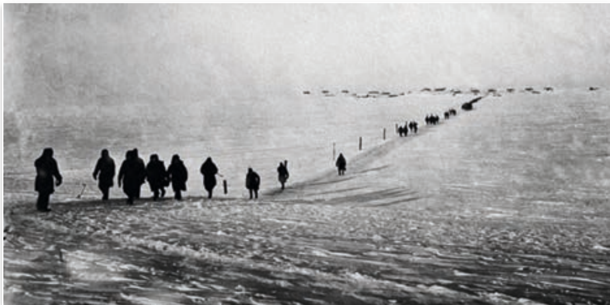
Captura de pantalla del documental «Gulag, the Story», de Patrick Rotman