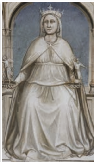
Alegoría de la virtud de la Justicia, por Giotto di Bondone - Capilla de los Scrovegni, Padua (Italia)

Quienes deberían ser los garantes de la ley se muestran especuladores oportunistas que la usan en favor de sus intereses personales