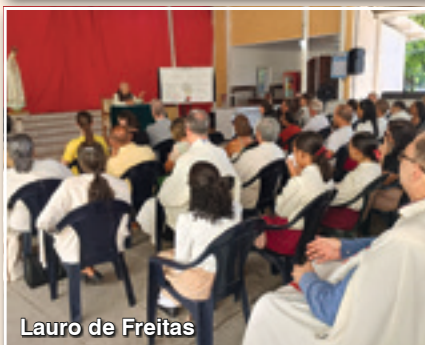
Lauro de Freitas