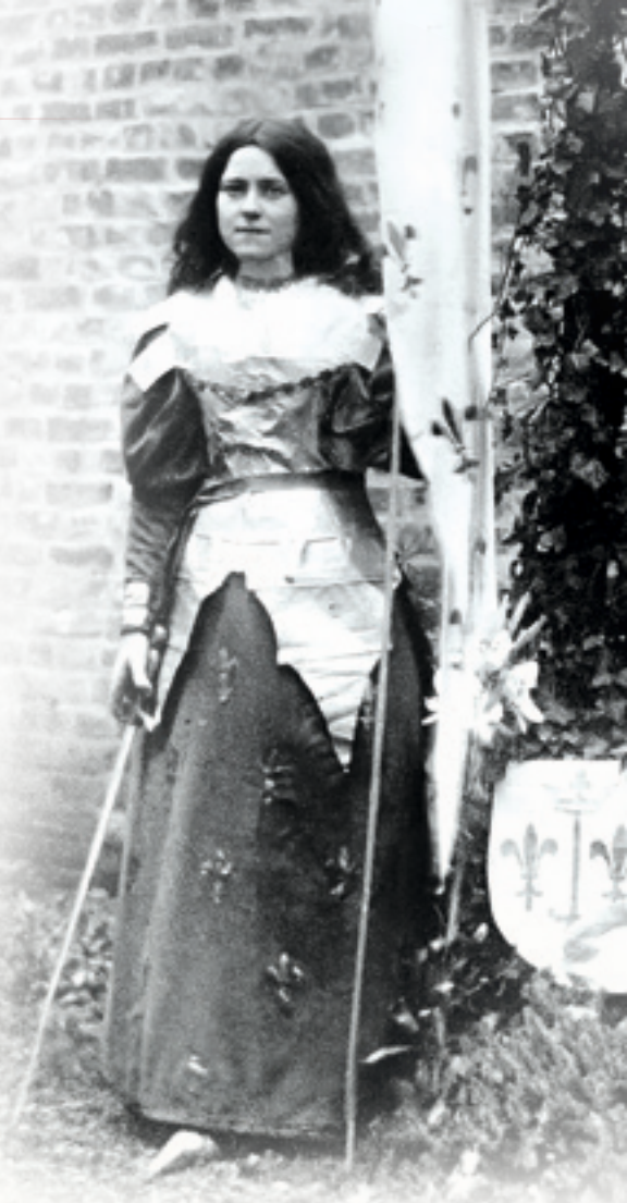
Arriba, Santa Teresa del Niño Jesús vestida de Juana de Arco, en 1895; a la izquierda, en el patio del Carmelo de Lisieux, en 1896

No obstante, mucho antes del abad de Sept-Fons, nuestro divino Modelo nos dio el ejemplo supremo. Al disponerse a comenzar su vida pública, Nuestro Señor Jesucristo pasó cuarenta días en retiro en el desierto; durante los tres años que predicó en Israel, previamente a cada gran acción se recogía en la soledad de las montañas para orar al Padre; por último, en vísperas de iniciar su pasión salvadora, se dirigió al huerto de los olivos para meditar y rezar. Nadie jamás ha actuado como el Redentor, ni con mayores frutos;