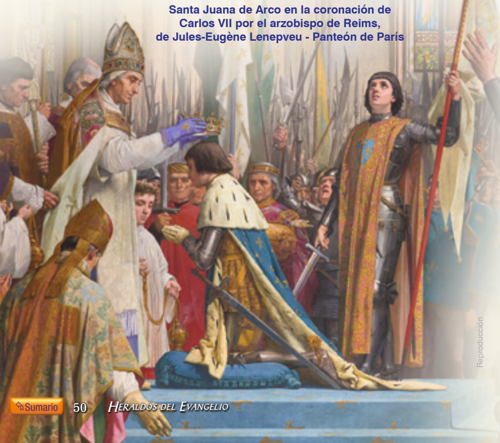
Santa Juana de Arco en la coronación de Carlos VII por el arzobispo de Reims, de Jules-Eugène Lenepveu - Panteón de París

En primer lugar, se sabe que la santa carmelita dirigió espiritualmente a dos misioneros y, por sus cartas, se percibe que comprendía las misiones mejor que ambos, y con más profundidad