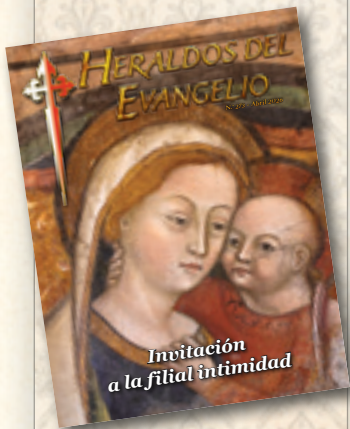
Nuestra Señora del Buen Consejo - Santuario dedicado a Ella en Genazzano (Italia)