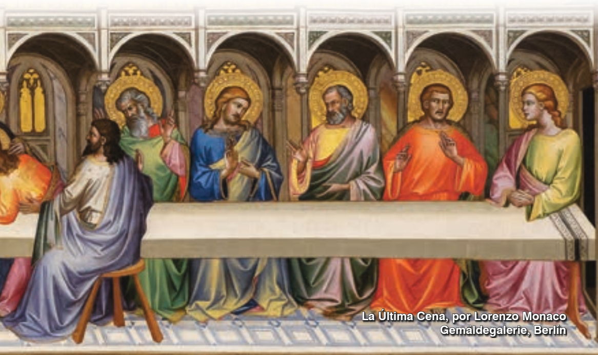
La Última Cena, por Lorenzo Monaco Gemäldegalerie, Berlín

Si no queremos ser contados entre los «que no creen», empecemos valorando la virtud de la fe, sin dejarnos abatir nunca por los dramas y dificultades de la vida