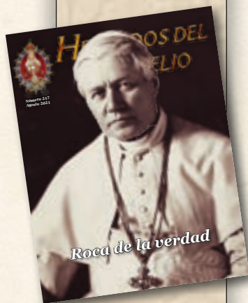
San Pío X

Por ese motivo los príncipes de la Iglesia, como cimas de esa sagrada roca, han de ser especiales depositarios de la «sana doctrina» (1 Tim 1, 10), «modelos del rebaño» (1 Pe 5, 3), edificando ante todo su propia casa; en caso contrario, como piedras de tropiezo, traerán gran ruina (cf. Mt 7, 27) para sí mismos y para innumerables almas. ✧