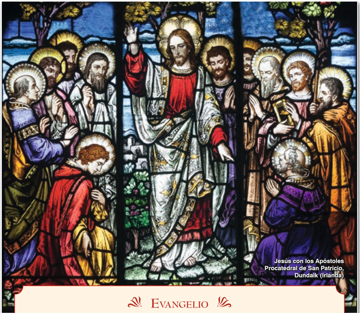
Jesús con los Apóstoles Procatedral de San Patricio, Dundalk (Irlanda)