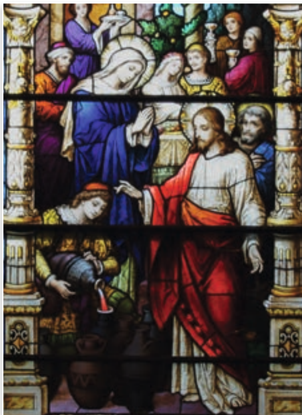
Las bodas de Caná - Iglesia de la Inmaculada Concepción, Saint Mary-of-the-Woods (EE. UU.)

Sin embargo, no debemos olvidarnos de que Dios siempre nos concede auxilios sobrenaturales necesarios para que superemos las pruebas a las cuales nos somete. Así pues, la algarabía provocada por las palabras de Jesús ponía de manifiesto únicamente la actitud interior de rechazo a la gracia que adoptaron aquellos murmuradores.