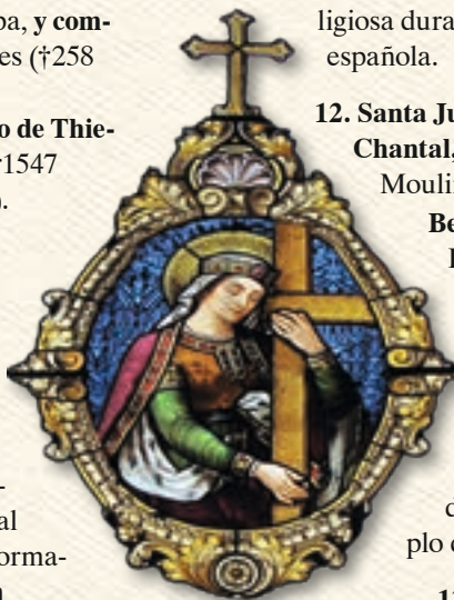
Santa Elena - Iglesia de San Quiliano, Alsacia (Francia)

Santa Rosa Fan Hui , virgen y mártir (†1900). En la persecución