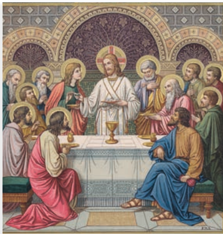
La Última Cena - Frontispicio de un Misal de 1910, editado por Friedrich Pustet

Cuando Nuestro Señor concluyó la predicación hubo de nuevo un rumor de descontento. Esta vez no provenía del público común, que ya se había retirado del lugar en señal de desaprobación a la doctrina expuesta.