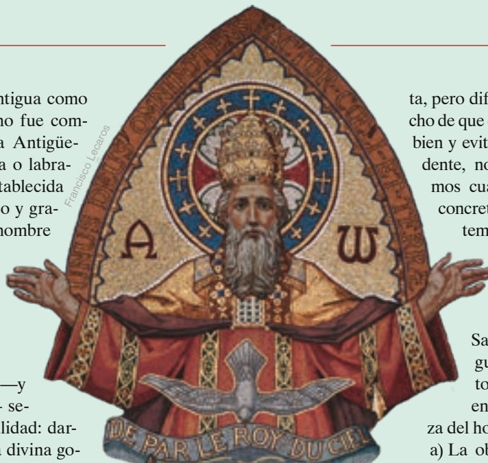
Dios Padre - Basílica de Santa Juana de Arco, Domrémy (Francia). En la página anterior, tormenta en el faro de Porthcawl (Gales)

He aquí el «principio primero y generalísimo» 8 de la ley natural, del