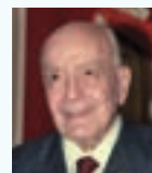
Plinio Corrêa de Oliveira

No consideramos con nostalgia una civilización católica del pasado, sino que miramos con esperanza hacia la época católica por excelencia que vendrá, el Reino de María. Y podemos, desde ahora, instaurar ese reinado en nuestro interior.