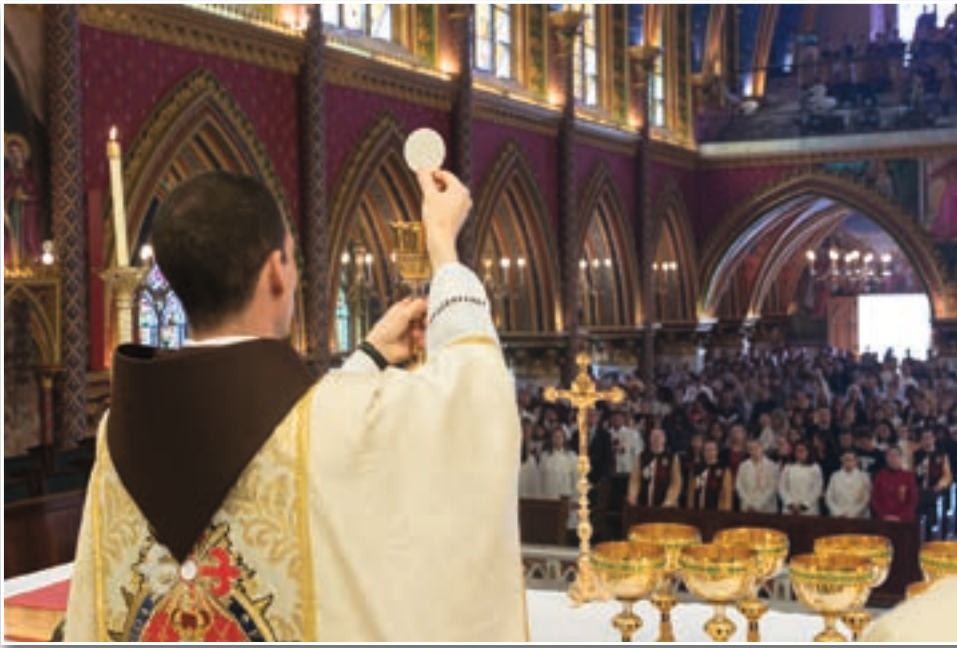
Celebración Eucarística en la basílica de Nuestra Señora del Rosario, Caieiras (Brasil)

los otros. La convivencia humana es como una permanente escalera mecánica: o bien las eleva hacia Dios, o bien las arrastra al pecado.