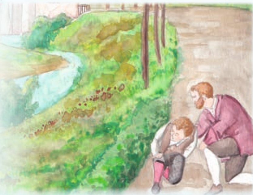
Ilustraciones: Tatiana Villegas

«Hijo mío, ¿no te acuerdas de mi promesa de no abandonarte nunca?»