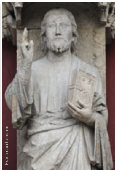
«Beau Dieu» - Catedral de Notre Dame de Amiens (Francia)

En mis veinticuatro años de docencia he hecho siempre esa introducción en el curso de Filosofía del Derecho cuando tenía que abordar el tema de la justicia, de sus relaciones con el derecho y la ley, intentando contextualizarlo todo en el ámbito de ese enigma que es la libertad humana, tratando de que los alumnos tomaran conciencia de que, al final, sólo se puede ser verdaderamente libre si se siguen ciertas reglas. Evidenciando que el problema no está en que haya o no haya reglas, sino única y exclusivamente en que éstas sean justas, puesto que el hombre, siendo por naturaleza llamado a vivir con los demás, no podrá rea-