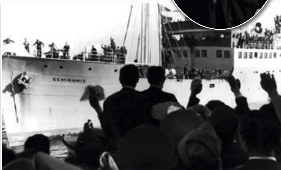
Llegada de los españoles repatriados al puerto de Barcelona, el 2/4/1954. En el destacado, el capitán Palacios durante el viaje de regreso a España