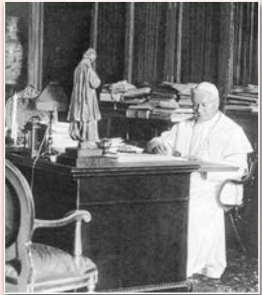
Supo reunir, esquematizar y anatematizar los errores modernistas que, como germen oculto, se infiltraban en el rebaño de Cristo

Como era costumbre, un poco más tarde recibiría en audiencia al Cuerpo Diplomático. Fue un encuentro rápido, pero tan emotivo y profundo que después uno de sus representantes le preguntó a Mons. Merry del Val, manifestándole un sentimiento compartido por todos: «Díganos, ¿qué tiene este hombre que tanto nos atrae?». El