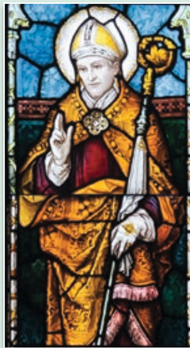
Andreas F. Borchert (CC by-sa 3.0)

Por otra parte, en estos tiempos en los que hay quienes abusan del poder pretendiendo cambiar estas «normas anteriores a cualquier ley humana», 25 «la ley natural constituye la verdadera garantía ofrecida a cada uno para vivir libre y respetado en su dignidad de persona, y para sentirse defendido de cualquier manipulación ideológica y de cualquier atropello perpetrado apoyándose en la ley del más fuerte». 26