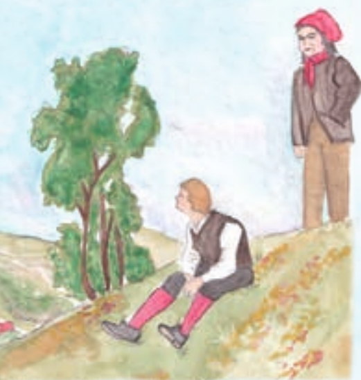
A medida que pasaba el tiempo, Leopoldo se estaba volviendo diferente...

Cuando parecía que estaba presto a ser descubierto, oyó un disparo que procedía del jacobino. Se siguieron unos instantes de silencio. De repente, percibió que aquella persona se estaba acercando... Pero, curiosamente, Gabriel ya no sentía pavor, se levantó y se encontró con su pa-