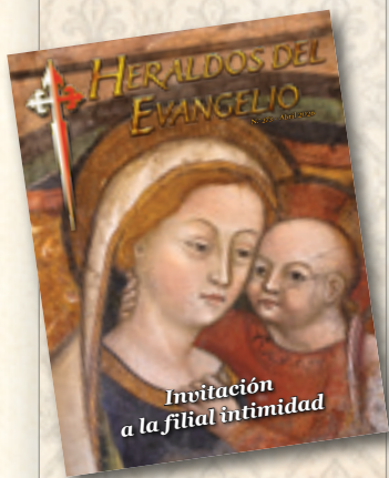
Nuestra Señora del Buen Consejo - Santuario dedicado a Ella en Genazzano (Italia)