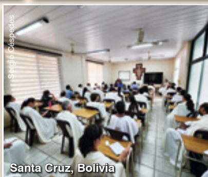
Santa Cruz, Bolivia