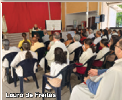
Lauro de Freitas