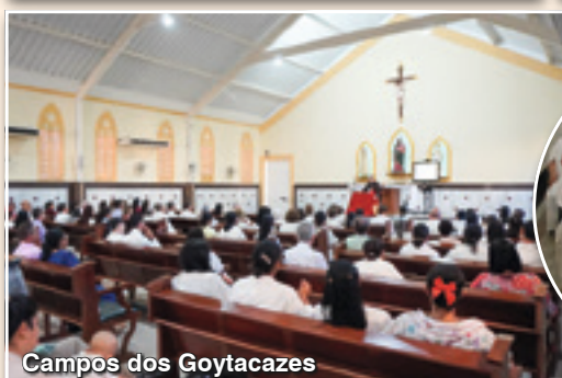
Campos dos Goytacazes