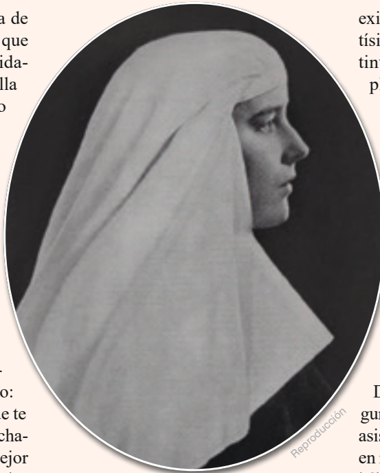
Apasionada en todo lo que hacía, decidió entregarse por completo, sin reservarse nada para el mundo

Desde sus primeros días en la vida consagrada, sor María Teresa mostró un único temor: el de ser una religiosa mediocre. Después de haberlo abandonado todo, quería ser una auténtica carmelita de la caridad y, para ello, empleó todas sus fuerzas y oraciones. ¡Y no piense el lector que el combate