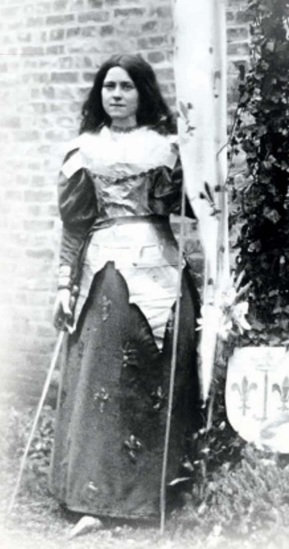
Arriba, Santa Teresa del Niño Jesús vestida de Juana de Arco, en 1895; a la izquierda, en el patio del Carmelo de Lisieux, en 1896

No obstante, mucho antes del abad de Sept-Fons, nuestro divino Modelo nos dio el ejemplo supremo. Al disponerse a comenzar su vida pública, Nuestro Señor Jesucristo pasó cuarenta días en retiro en el desierto; durante los tres años que predicó en Israel, previamente a cada gran acción se recogía en la soledad de las montañas para orar al Padre; por último, en vísperas de iniciar su pasión salvadora, se dirigió al huerto de los olivos para meditar y rezar. Nadie jamás ha actuado como el Redentor, ni con mayores frutos;