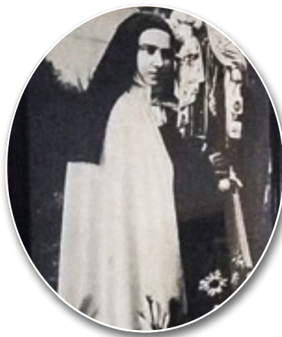
A través de sor Ignez, se inicia una nueva devoción, inspirada por el Cielo

Con la aprobación eclesiástica, las carmelitas se pusieron a difundir la devoción a Nuestra Señora de la Saudade, enviando a varias diócesis de Brasil folletos con una oración llamada Corona de saudades de la Reina de los mártires y la petición de que los agraciados remitieran al convento relatos de las gracias recibidas.