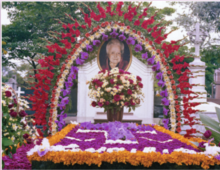
Los que buscan refugiarse a la sombra de esa bondadosa señora forman una familia de almas que se reconocen pequeñas y contingentes

Sea como fuere, la protagonista sigue siendo la misma. Por eso, resulta interesante buscar en su psicología durante su peregrinación por este mundo elementos que nos ayuden a entender su actuación en el otro.