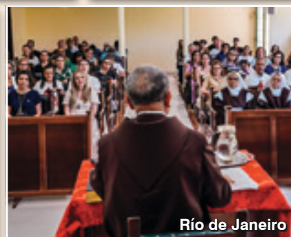
Río de Janeiro