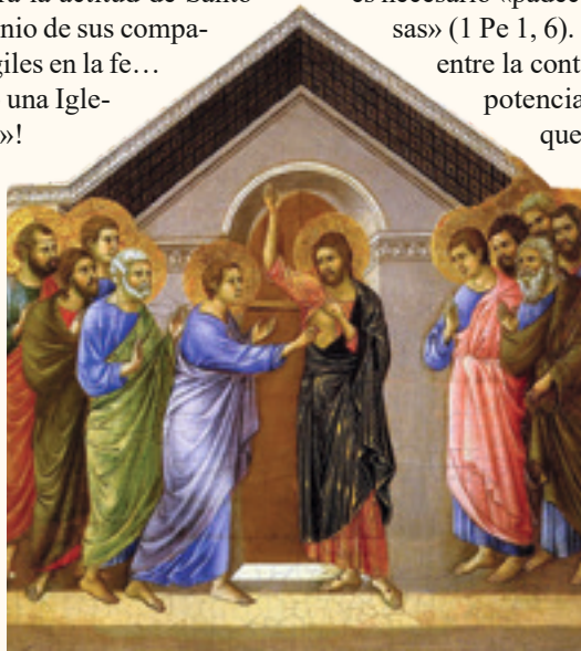
La incredulidad de Santo Tomás, detalle de la «Maestà», de Duccio di Buoninsegna - Museo dell'Opera del Duomo, Siena (Italia)

Si hoy se me diera el poder de guiar los pasos de la Iglesia naciente, ¿lo haría como el Señor?