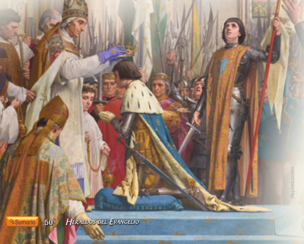
Santa Juana de Arco en la coronación de Carlos VII por el arzobispo de Reims, de Jules-Eugène Lenepveu - Panteón de París

En primer lugar, se sabe que la santa carmelita dirigió espiritualmente a dos misioneros y, por sus cartas, se percibe que comprendía las misiones mejor que ambos, y con más profundidad