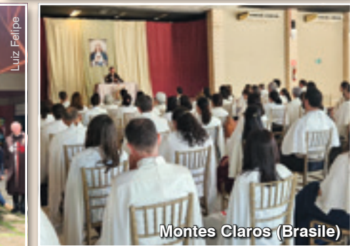
Montes Claros (Brasile)