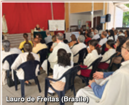
Lauro de Freitas (Brasile)