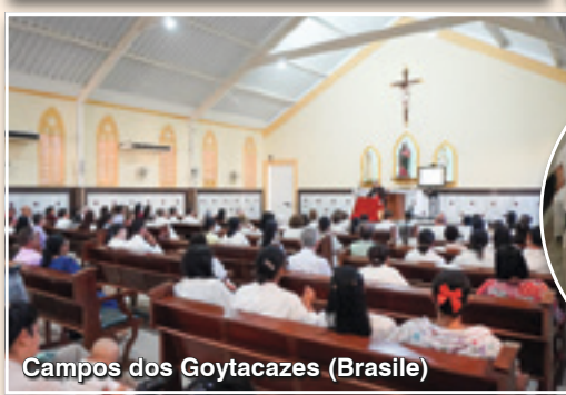
Campos dos Goytacazes (Brasile)