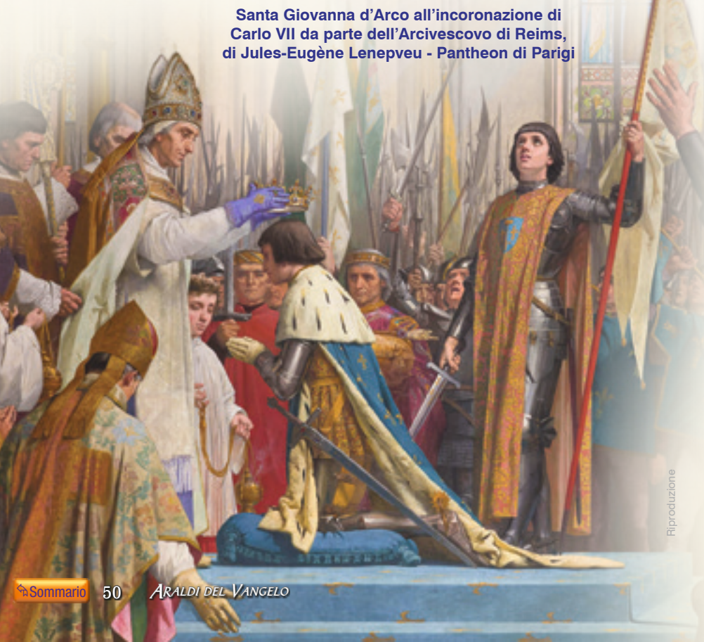
Santa Giovanna d’Arco all’incoronazione di Carlo VII da parte dell’Arcivescovo di Reims, di Jules-Eugène Lenepveu - Pantheon di Parigi

In primo luogo, è noto che la santa carmelitana diresse spiritualmente due