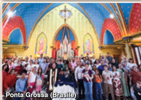
Ponta Grossa (Brasile)