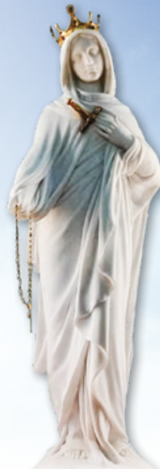
La Statua ricorda al fedele l'intensità del dolore sofferto da Nostra Signora durante la Passione

Spesso il convento riceveva notizie di grazie ottenute mediante la devozione, che si diffondeva e fioriva in ogni angolo della nazione. Nel 1948,