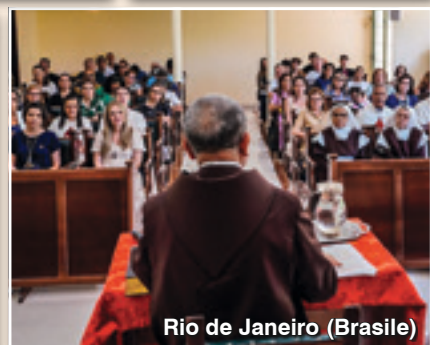
Rio de Janeiro (Brasile)