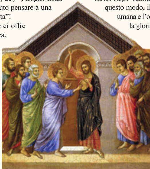
L'incredulità di San Tommaso, dettaglio della “Maestà”, di Duccio di Buoninsegna - Museo dell'Opera del Duomo, Siena

Se oggi mi fosse dato il potere di guidare i passi della Chiesa nascente, lo farei come fece Nostro Signore?