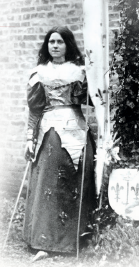
Sopra, Santa Teresina del Bambino Gesù vestita come Giovanna d'Arco, nel 1895; a sinistra, nel cortile del Carmelo di Lisieux, nel 1896

Tuttavia, molto prima dell'abate di Sept-Fons, il nostro Divin Modello ci aveva dato l'esempio supremo. Prima di iniziare la sua vita pubblica, Nostro Signore Gesù Cristo trascorse quaranta giorni in ritiro nel deserto; nei tre anni in cui predicò in Israele, prima di ogni grande azione Si ritirava nella solitudine dei monti per pregare il Padre; infine, nel dare inizio alla sua Passione salvifica, Si recò nell'Orto degli Ulivi per meditare e pregare. Nessuno ha mai agito come il Redentore, né con