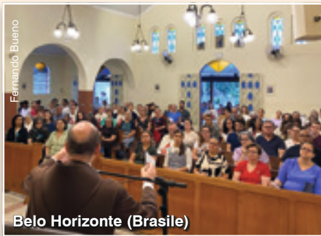
Belo Horizonte (Brasile)