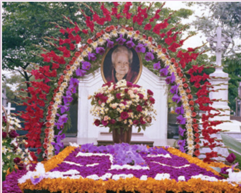
Coloro che cercano di rifugiarsi all'ombra di questa buona signora formano una famiglia di anime che si riconoscono piccole e contingenti

In ogni caso, la protagonista rimane la stessa. Per questo motivo, sembra interessante cercare, nella sua psicologia durante il pellegrinaggio in questo mondo, elementi che ci aiutino a comprendere il suo operato nell'altro.