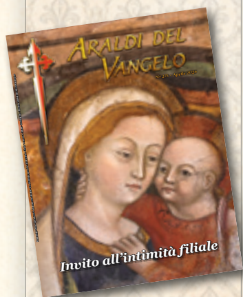
Madonna del Buon Consiglio - Santuario a Lei dedicato a Genazzano (Roma)