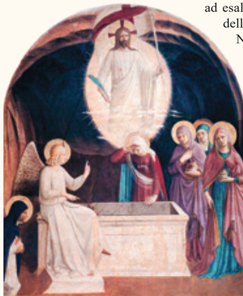
Resurrezione di Cristo, del Beato Angelico - Museo di San Marco, Firenze