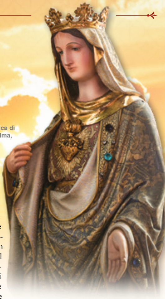
Cuore Immacolato di Maria - Basilica di Nostra Signora del Rosario di Fatima, Cotia (Brasile)

Ciononostante, sembra esserci una vittoria graduale di Nostra Signora, segnata dal modo in cui le persone progrediscono spiritualmente. A mio avviso, ciò non sarebbe spiegabile senza quell'ausilio dato ai deboli, ai piccoli, che corrisponde al motto della Chiesa