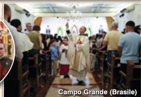
Campo Grande (Brasile)