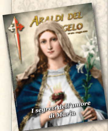
Cuore Immacolato di Maria - Collezione privata