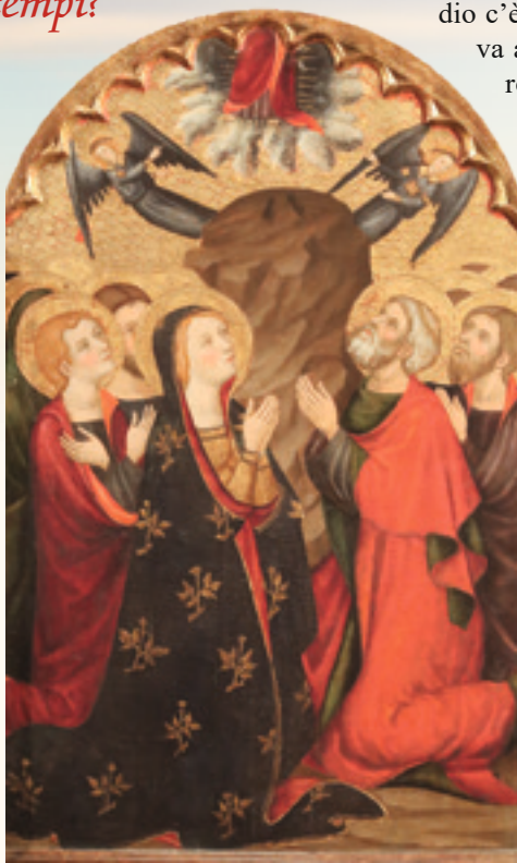
“Ascensione”, di Pedro Serra - Basilica Collegiata di Santa Maria dell'Aurora, Manresa (Spagna)