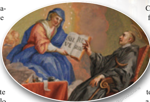
Apparizione della Madonna al Beato Ermanno, di Josef Ferdinand Fromiller - Abbazia di Ossiach (Austria)

Ermanno fu inviato dai genitori in un monastero benedettino come oblato, dove ricevette un'eccellente formazione. Nonostante la salute cagionevole – soffriva di una sorta di paralisi; in latino medievale, contractus significa zoppo ,