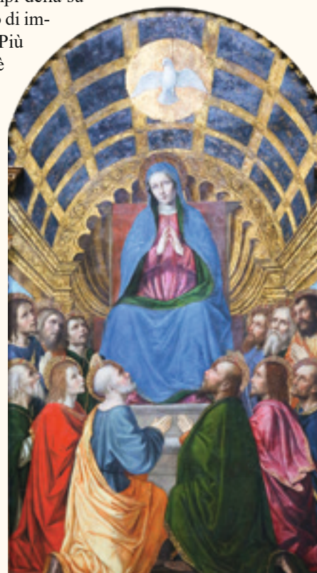
"Pentecoste" - Chiesa dello Spirito Santo, Bergamo

Non c'è una terza via. O optiamo per la via di Babele, o per la via di Pentecoste