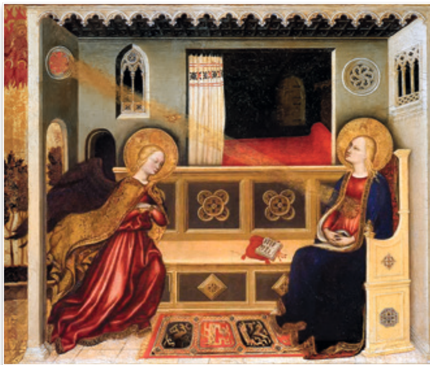
“Annunciazione”, di Gentile da Fabriano - Pinacoteca Vaticana; nella pagina precedente, “Incoronazione della Vergine”, di Agnolo Gaddi - National Gallery, Londra

Nel dicembre del 1531, la Madre di tutti i popoli apparve nella Nuova Spagna, l’odierno Messico, all’indigeno Juan Diego, rivelando una profonda predilezione per le terre americane e i loro nativi. Uno dei simboli principali dell’apparizione è il nahui ollin , che fa riferimento al fiore di quattro petali raffigurato sul ventre della Vergine e che racchiudeva, per gli aborigeni, la nozione di “centro della Storia”. Con questa manifestazione emblematica, Maria volle manifestare il suo desiderio