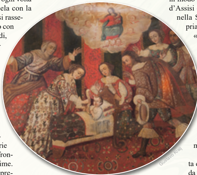
La salutatione angelica sia per noi consolazione e protezione nelle angosce e nelle necessità, così come per San Tommaso si trasformò in stendardo, scudo e baluardo nelle battaglie

Noi, deboli peccatori, dobbiamo imparare a "disobbedire" come il piccolo Tommaso, per aggrapparci a questa inespugnabile «torre di Davide» (Ct 4, 4). Nei pericoli, nelle angosce, nei dubbi, ricorriamo sempre alla Madonna, anche solo pronunciando il suo nome: Maria! ✚