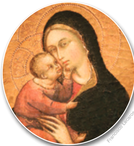
Prima di tutti i secoli, Maria fu predestinata a realizzare la sublime opera di Dio: l’Incarnazione del Verbo

Ogni fedele è ugualmente chiamato a rispondere con il proprio “sì” alla vocazione universale alla santità. Per questo, non c’è nulla di meglio che seguire l’esempio di Colei che tutte le generazioni chiameranno beata, perché in Lei l’Onnipotente ha compiuto meraviglie (cfr. Lc 1, 48-49). Anche in noi, mediante la grazia, Egli potrà compiere grandi cose. ✠