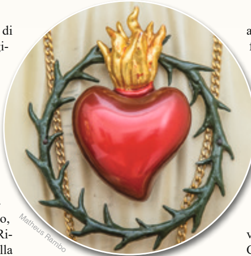
Cuore Immacolato di Maria - Collezione privata

Tale ipotesi è in linea con quanto afferma San Luigi Grignon de Montfort riguardo al dispiegarsi del mistero della grazia. Nel corso dei secoli è esistita una devozione alla Madonna che, a un certo punto, per Suo desiderio, ha cominciato ad assumere una consistenza maggiore. La devozione alla Santissima Vergine sviluppa nelle