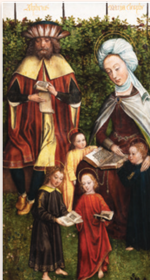
Il disegno che aleggiava sulla famiglia si manifestò nel corso della vita di Gesù. Ma a Giacomo sarebbe spettato un ruolo fondamentale

Il canone del Nuovo Testamento ha conservato altri riferimenti a questa autorità. Troviamo, ad esempio, nell'ultima delle epistole cattoliche: «Giuda, servo di Gesù Cristo, fratello di Giacomo , agli eletti che vivono nell'amore di Dio Padre e sono stati preservati per Gesù Cristo» (Gd 1, 1). Analogamente, gli Atti degli Apostoli narrano che, arrestato per ordine di Erode, Pietro fu liberato da un Angelo e, prima di lasciare la città per