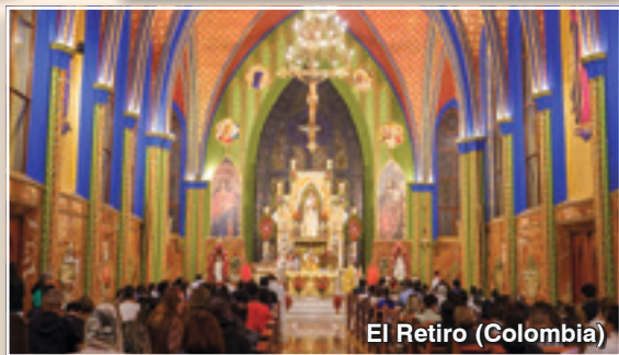
El Retiro (Colombia)