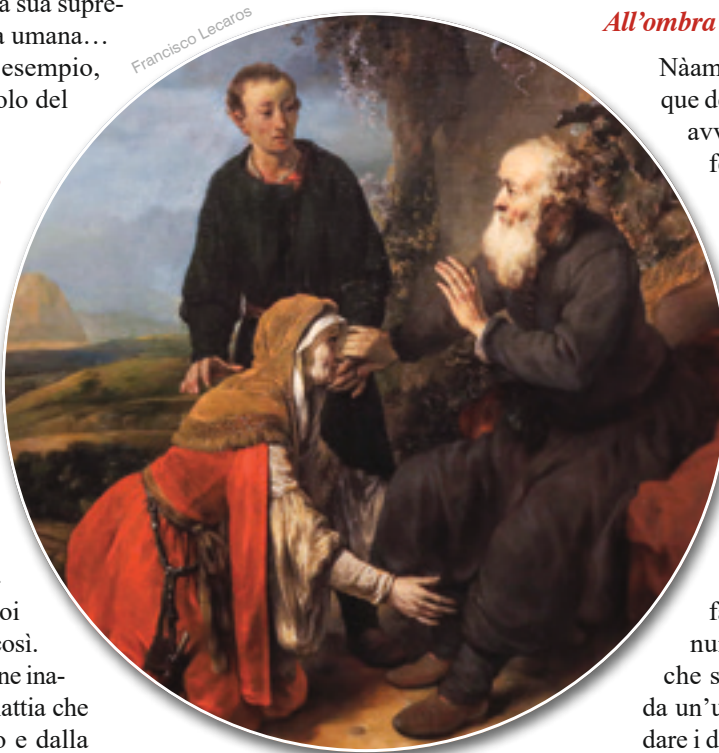
Ghecazi era l'uomo di fiducia del profeta e il testimone dei grandi prodigi da lui compiuti

Ghecazi – come lo chiama la Scrittura – era, dunque, l'uomo di fiducia del profeta e il testimone dei grandi prodigi da lui compiuti. Certamente era stato presente quando Eliseo aveva fatto riempire a una vedova numerose anfore con l'olio che sgorgava miracolosamente da un'unica brocca, al fine di saldare i debiti del suo defunto marito (cfr. 2 Re 4, 1-7). In un'altra occasione, era stato su suo suggerimento che Eliseo aveva profetizzato la nascita di un figlio a una certa donna sunammita che lo aveva favorito