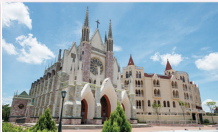
Basilica di Nostra Signora del Rosario di Fatima, Cotia (Brasile)