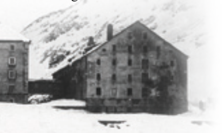
Canonico con cani di razza San Bernardo - Monastero e rifugio della Congregazione del Gran San Bernardo, Alpi del Vallese (Svizzera)

Nel decennio del 1880, per rendere omaggio al fondatore di quel centro di accoglienza per pellegrini, il nome della razza canina fu standardizzato come San Bernardo . Fu nel 1923 che Pio XI proclamò il Santo di Mentone patrono degli alpinisti. ✚