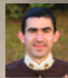
✎ Santiago Vieto Rodríguez

Ci sono opere d'arte che colpiscono per la loro perfezione tecnica, il realismo e la vivacità, invitandoci ad andare oltre... Entrando in un'atmosfera di mistero, percepiamo poco a poco i loro diversi "elementi", in una composizione che sembra volerci trasmettere un messaggio.