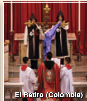
El Retiro (Colombia)