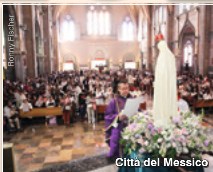
Città del Messico