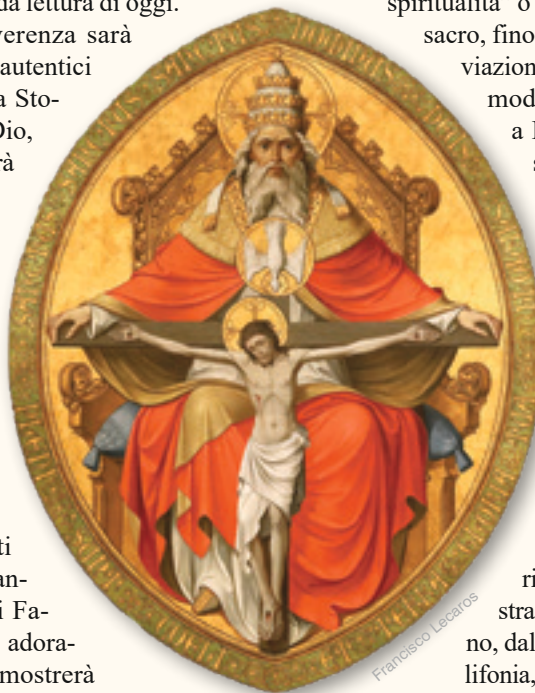
Santissima Trinità - Cattedrale di Colonia (Germania)

Quanto queste realtà esteriori ci aiutano a comprendere appieno che siamo portatori di questo altissimo mistero: Dio Padre, Figlio e Spirito Santo vivono in noi! ✠