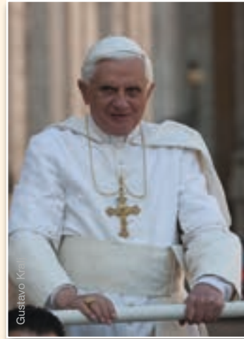
Bento XVI – Acompanha-nos neste itinerário a Virgem Santa, que seguiu em silêncio o Filho Jesus até o Calvário, participando com grande dor no seu sacrifício, cooperando assim no mistério da Redenção.

análise da sua associação ao sacrifício redentor de Cristo . Já Santo Agostinho atribui à Virgem a qualificação de 'cooperadora' da Redenção . [...] Aplicado a Maria, o termo 'cooperadora' assume, porém, um significado específico. A colaboração dos cristãos na salvação atua-se depois do evento do Calvário, cujos frutos eles se empenham em difundir mediante a oração e o sacrifício. O concurso de Maria, ao contrário, atuou-se durante o evento mesmo e a título de Mãe; estende-se, portanto, à totalidade da obra salvífica de Cristo. Somente Ela esteve associada deste modo à oferta redentora, que mereceu a salvação de todos os homens . Em união com Cris-