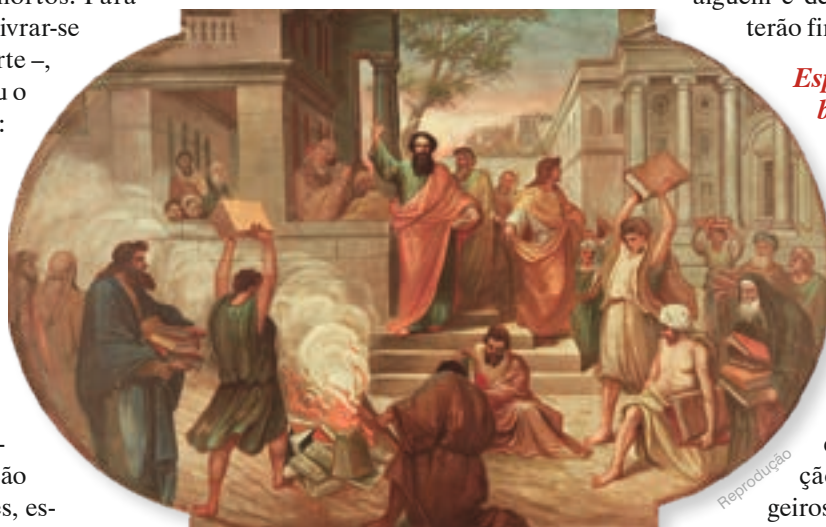
Cena da vida de São Paulo - Basilica de São Paulo, Toronto (Canadá)

A solução desta questão está no fato de que a sagacidade, enquanto fazendo parte da virtude da prudência, comporta três sentidos ou níveis.