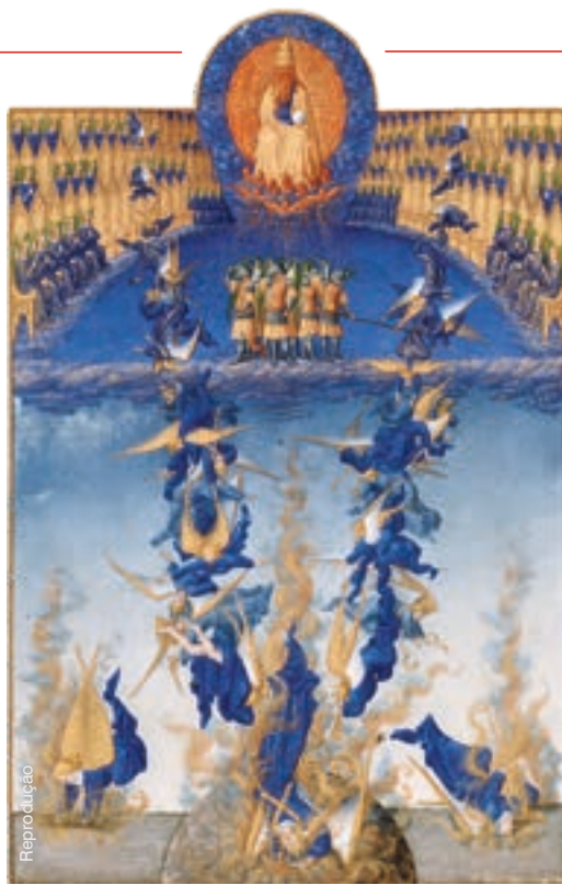
Queda dos anjos rebeldes - Les Très Riches Heures du Duc de Berry, Castelo de Chantilly (França)

É interessante notar que a narrativa da criação da luz vem seguida imediatamente de sua separação das tre-