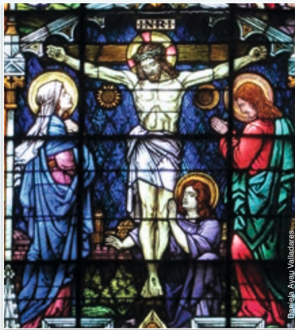
Nossa Senhora de pé, junto à Cruz - Universidade Nossa Senhora do Lago, San Antonio (EUA)

Pio XII: “Na realização da Redenção humana, quis Deus que a Santíssima Virgem Maria estivesse inseparavelmente unida a Cristo; deste modo, nossa salvação é fruto da caridade de Jesus Cristo e de seus padecimentos associados intimamente ao amor e às dores de sua Mãe; assim, é de todo razoável que o povo cristão, que recebeu de Jesus a vida divina por meio de Maria, depois de tributar as devidas homenagens ao Sacratíssimo Coração de Jesus, tribute também ao