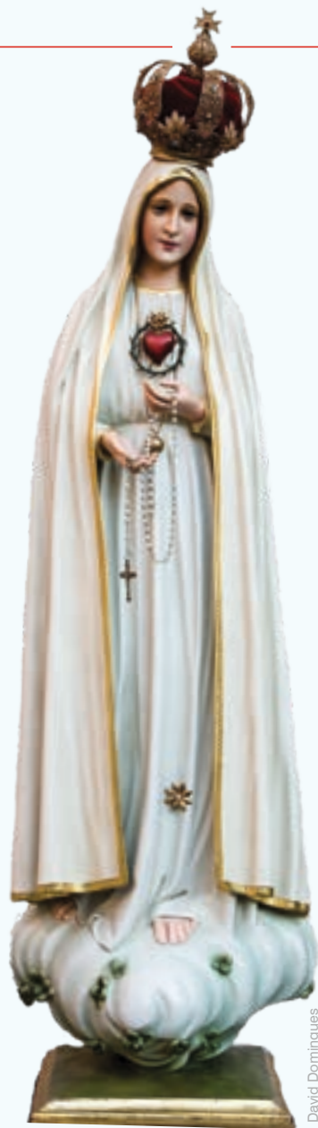
Imaculado Coração de Maria - Igreja de San Benedetto in Piscinula, Roma

A essa objeção, respondo do seguinte: “Há um modo melhor de festejar um profeta do que pronunciando um ato de fé na sua mensagem?” A Santíssima Virgem revelou tudo isso por