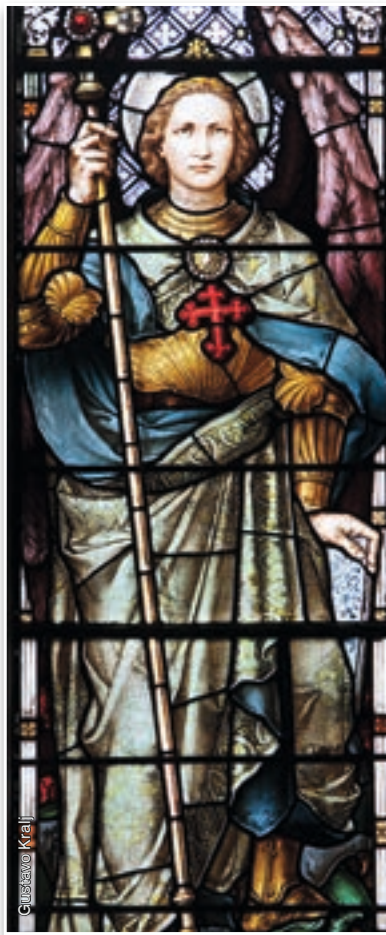
São Miguel Arcanjo - Igreja de Santa Maria, Waltham (EUA)

“Quem é como Deus?” Eis o brado desafiador de um cavaleiro sem mancha, que discerne a fundo a grandeza do Altíssimo