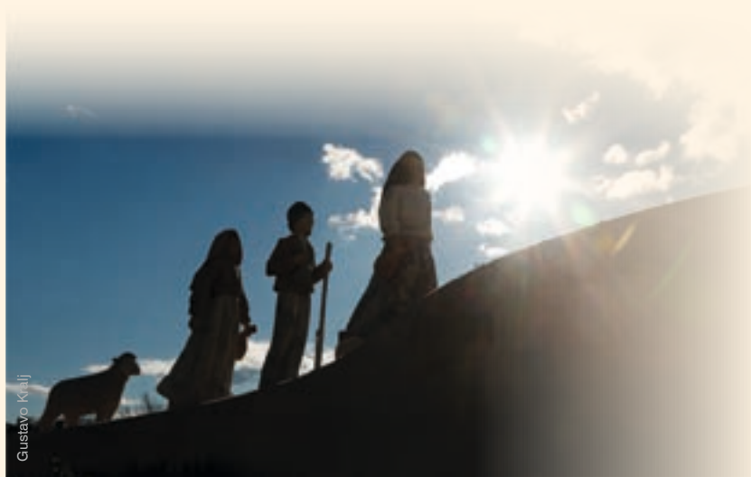
Lúcia, Francisco e Jacinta - Paroquia Matriz de Fátima, (Portugal)

Extraído, com pequenas adaptações, de: Dr. Plínio . São Paulo. Ano XVI. N.179 (fev., 2013); p.28-30