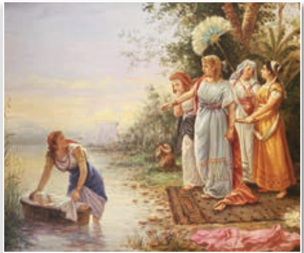
À esquerda, bandidos assaltando um viajante, por Leonardo Alenza - Museu de Belas Artes, Bilbao (Espanha); à direita, encontro de Moisés nas águas do Nilo - Igreja de São Domingos de Silos, Córdoba (Espanha)