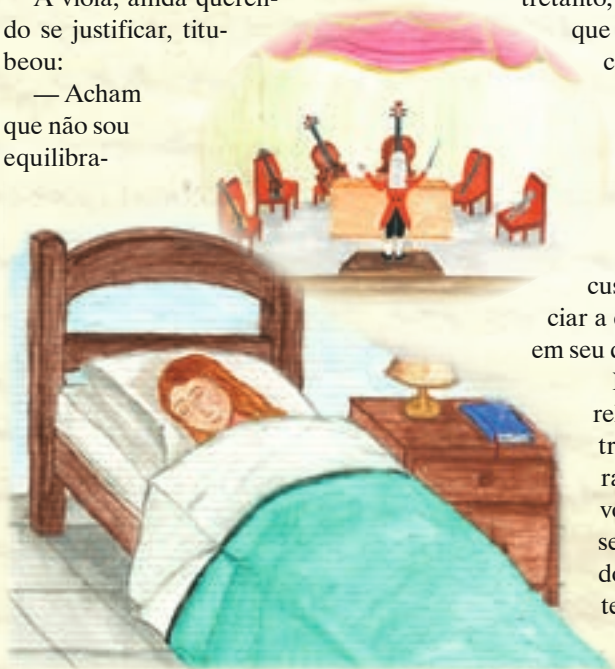
De repente, escutei o despertador e acordei. Tudo fora um sonho...

Contudo, as cenas que nele vi se assemelhavam com um aspecto da realidade que os seres humanos enfrentam no dia a dia. Quando olhamos para nós mesmos, vemos defeitos, que evidentemente existem e atrapalham nossa via para o Céu. Entretanto, superamos tais obstáculos quando colocamos a nossa atenção na partitura e, sobretudo, no Divino Regente, que tudo harmoniza e soluciona! ✧