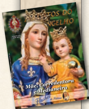
Maria Auxiliadora - Casa de Formação Thabor, Caieiras (Brasil)

Plêiades de Santos, Papas e a própria Nossa Senhora prenunciaram uma futura era marial, para a qual Ela já está preparando seus filhos diletos. Considerando o paroxismo de pecado a que chegou o mundo hodierno, por que não supor que isso se efetivará por meio de uma analógica “redenção”, cujas características ainda não nos foram desveladas? Nada mais plausível. E, se a nossa hipótese se confirmar, novos atributos marianos brotarão dos lábios dos fiéis, confirmando o famoso dito de São Bernardo: “De Maria nunca se dirá o suficiente”. ✧