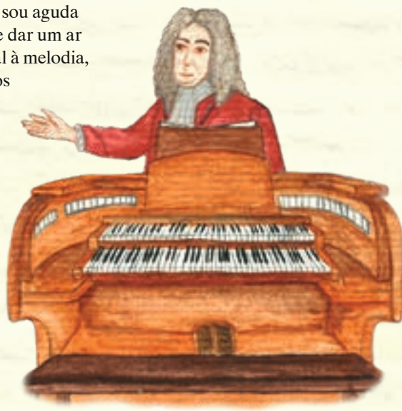
A um sinal do compositor todos iniciaram a magnífica abertura

Na velocidade do relâmpago, os instrumentos se puseram nos respectivos lugares: o órgão se colocou no centro do palco; o trompete foi para o fundo, com a intenção de ser mais humilde; depois veio o oboé e se dis-