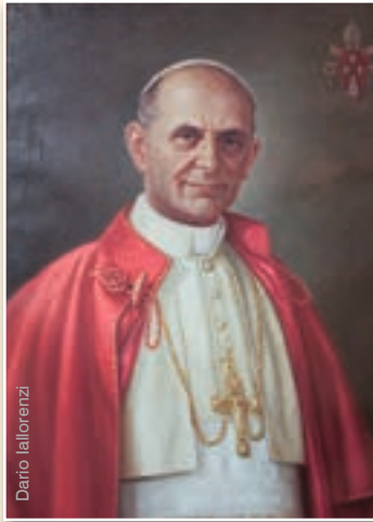
Paulo VI - A reforma pós-conciliar considerou a Virgem Maria com uma perspectiva adequada no mistério de Cristo; reconheceu-Lhe o lugar singular que Lhe compete no culto cristão, enquanto alma cooperadora do Redentor.