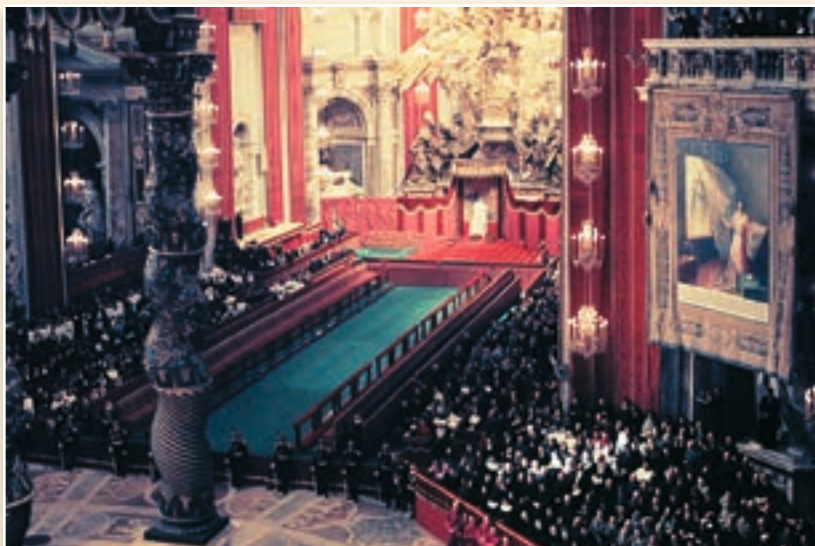
Missa Papal no Altar da Cátedra, na Basílica de São Pedro, antes de uma das sessões do Concílio Vaticano II

“No decurso dos séculos a Igreja refletiu sobre a cooperação de Maria na obra da salvação, aprofundando a