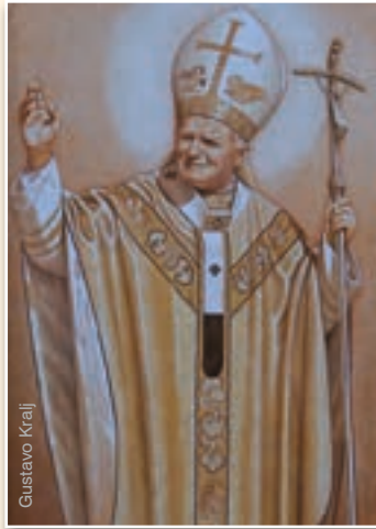
João Paulo II – Enquanto concebida e nascida sem a mancha do pecado, Maria, participou de forma admirável nos sofrimentos do seu Divino Filho, a fim de ser Corredentora da humanidade.