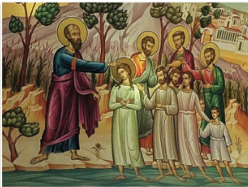
São Paulo batizando Lídia e sua família - Batistério de Santa Lídia, Cavala (Grécia)

Deus” (At 16, 14), ou seja, voltada para Ele. “Lídia possuía uma dessas almas tão naturalmente cristãs que, tendo ouvido falar de Jesus, logo O reconheceu como o Caminho, a Verdade e a Vida”. 4