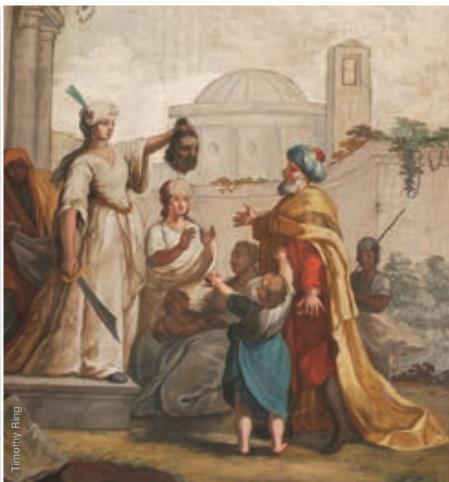
Judite com a cabeça de Holofernes - Catedral de Lisboa

Tomou então a espada que estava à cabeceira do leito e, após rezar interiormente para que o Deus de Israel lhe desse forças, desferiu dois golpes na nuca do general, arrancando-lhe a cabeça. Em seguida, envolveu-a em um pano e saiu do acampamento com a criada. Como isto já era costume, os guardas nada estranharam.