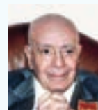
Plínio Corrêa de Oliveira

A Igreja é o centro do gênero humano e a entidade que a Santíssima Virgem mais ama na terra. Ora, tendo se iniciado por ela o castigo predito por Nossa Senhora em Fátima, não temos todas as razões para temer seus efeitos sobre a sociedade civil, se esta persevera no mal?