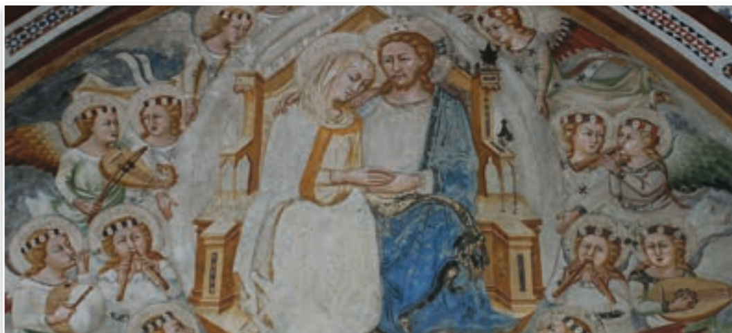
Glória de Maria Santíssima com Nosso Senhor Jesus Cristo Cappella della Madonna no Mosteiro Beneditino de Subiaco (Itália)