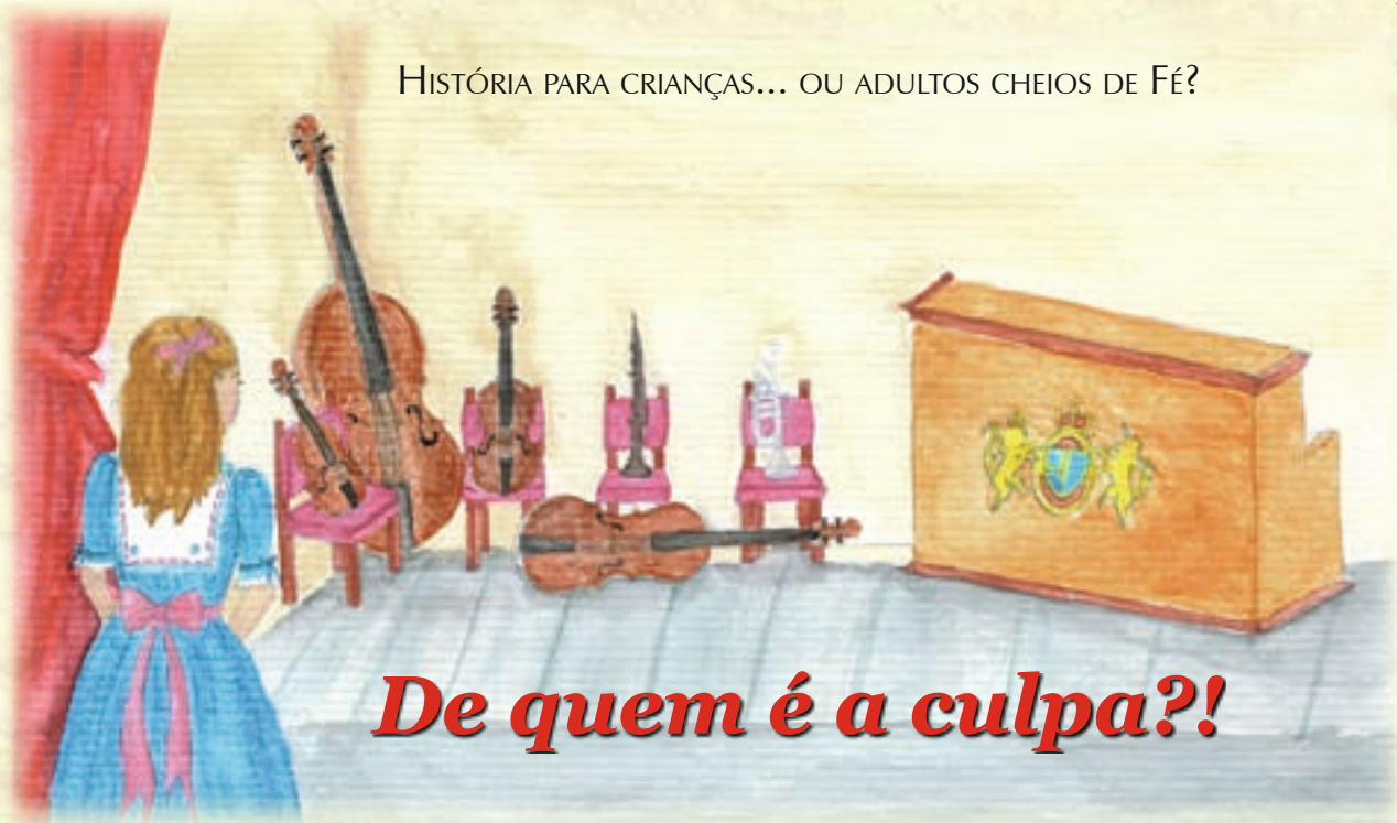
Ilustração: Tatiana Villegas