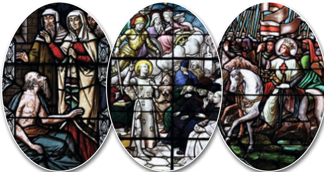
Da esquerda à direita: Jó - Igreja Sainte-Segolène, Metz (França); Santa Joana d'Arc sendo julgada - Igreja Notre-Dame la Grande, Poitiers (França) e São Luís Rei nas Cruzadas - Igreja de São Saturnino, Baurech (França)

Num sentido mais amplo, encaixam-se nessa divina diplomacia as perseguições que ao longo da História se levantam contra os bons, pondo-os em choque com o mal e incitando-os a defender a verdade. Deus as permite para apurar a fé de seus eleitos e, após cada embate, faz surgir maravilhas maiores na Santa Igreja.